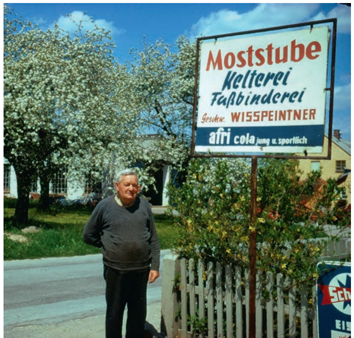
Die Moststube, Kellerei und Fassbinderei Wisspeintner.