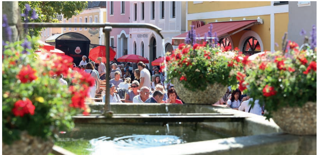
Am Marktplatz wird ein großer Biergarten aufgebaut, die Ortenburger Geschäfte öffnen und Live-Musik sorgt für beste Stimmung.

Am 17. September haben in Ortenburg von 11 bis 16 Uhr die Geschäfte beim verkaufsoffenen Sonntag geöffnet. Dort finden sich neueste Trends und attraktive Herbstangebote. Das Marktprogramm, das sich über Ortsmitte und angrenzende Straßen erstreckt, ist abwechslungsreich und für die ganze Familie gedacht. Besucher können sich auf etwa 40 Marktstände freuen, die eine breite Palette an Angeboten präsentieren. Von Herbstangeboten über faszinierende Herbstdekorationen bis hin zu einzigartigem