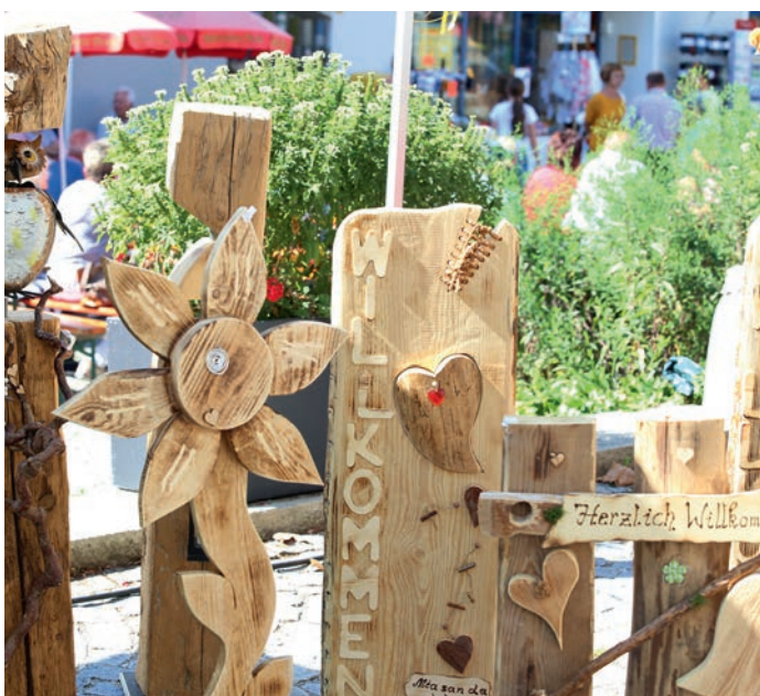
Über 40 Fieranten präsentieren sich mit ihrem abwechslungsreichen Warenangebot.

Also gleich einspeichern, Familien-Event am 17. September in Ortenburg beim Herbstmarkt mit verkaufsoffenem Sonntag. Ein Event, das die Gelegenheit bietet die ganze Pracht des Herbstes zu erleben. Egal ob alleine, mit Familie oder Freunden – alle Besucher sind herzlich willkommen.