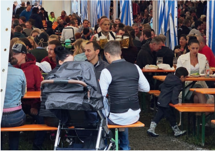
Trotz des regnerischen Wetters freute sich der Gewerbeverein über zehntausende Besucher beim traditionellen Ortenburger Volksfest.

Zahlen“, wo sich die Beteiligten künstlerisch betätigen konnten. Beim sonntäglichen Festzug war der Wettergott gnädig. Während des Zuges blieb der Regen aus und so konnten sich die Teilnehmer – übrigens so viele Gruppen wie selten zuvor – unter Jubeln und Klatschen der Zuschauer trockenen Fußes über den Marktplatz schlängeln. Für die kleinen Besucher wurde der Kinderfahrradkorso veranstaltet, bei dem es für die drei