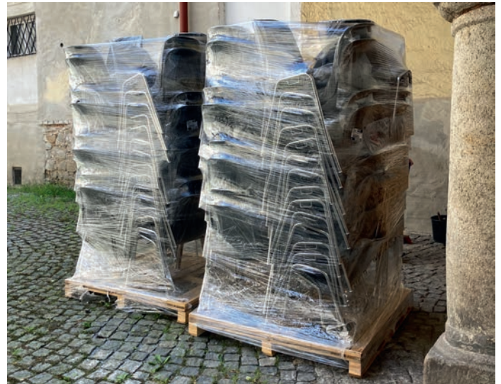
Der Förderverein freut sich darauf, die neuen Stapelstühle am 21. Oktober zusammen mit den Besuchern des Symposiums einweihen zu können.

In sieben halbstündigen Vorträgen wird gemeinschaftlich beleuchtet werden, wie die Grafschaften Ortenburg, Hals und Neuburg (am Inn) sowie das Hochstift Passau unter den Einflüssen ihrer großen Nachbarn ihre Herrschaftsbereiche entwickelten. Damals entstand auch die heutige Söldenauer Schlossanlage als mittelalterliche Burg Kamm, deren Gründerfamilie später die Grafschaft Hals errichteten, sodass das Symposium an einem histo-