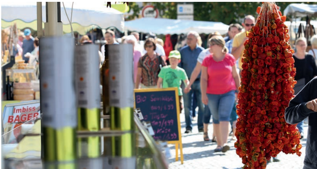
Der Ortenburger Gewerbeverein lädt am Sonntag, den 17. September zum Herbstmarkt nach Ortenburg ein.

nicht entgehen lassen, wertvolle Gartentipps vom Verein für Gartenbau- und Landschaftspflege zu erhalten.