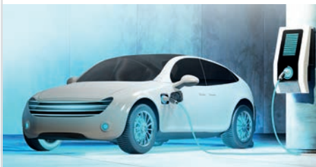
Arbeiten für die Branchen der Zukunft