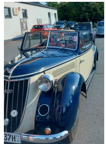
Attraktive Hingucker aus Ortenburg: Wo immer die Fahrzeuge aus der Teilnehmerrunde auftauchten, zogen sie die Blicke der Passanten auf sich.

In der KTM-Motorhall warteten bereits zwei Tour-Guides und führten die Oldtimerfreunde in zwei Gruppen durch die beeindruckende Ausstellung der verschiedenen Epochen des Herstellers KTM. Auf diversen alten und neuen Zwei- und auch Vierrädern durfte nach Belieben auch probegessen werden, so dass sich jeder ein Bild vom mehr oder weniger vorhandenen Fahrkomfort machen konnte. Ergänzt wurden die subjektiv gewonne-