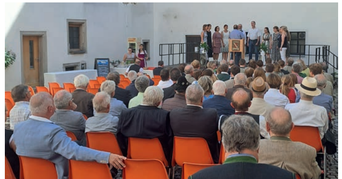
Für die musikalische Umrahmung der Feier mit rund 120 Gäste im Schlossinnenhof sorgte der A-Capella-Chor „Hochhausprojekt“.