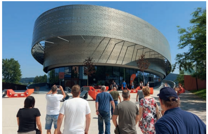
In der KTM-Motorhall im österreichischen Mattighofen wartete eine Ausstellung auf die Oldtimerfreunde – inklusive Probesitzen auf alten und neuen Zwei- bzw. Vierrädern. Fotos und Text: MSC Ortenburg

Bei strahlendem Sonnenschein fand am 15. August wieder die alljährliche Ausfahrt der historischen Fahrzeuge des MSC Ortenburg statt. Um 9 Uhr starteten 30 Old- und Youngtimer auf zwei und vier Rädern mit ihren Besatzungen von Ortenburg weg. Ziel war diesmal die KTM-Motorhall des Motorradherstellers im österreichischen Mattighofen. Auf verkehrsarmen Nebenstraßen ging die Fahrt in mehreren Fahrzeuggruppen-