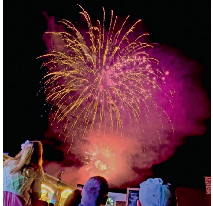
Höhepunkt des Volksfestes war das große Feuerwerk am Dienstag.

am schönsten geschmückten, die drei originellsten und das älteste Fahrrad je einen tollen Preis gab. Rund 100 Kinder machten hier mit. Beim Ortenburger Vierkampf mussten sich die Teams in den Disziplinen Bobycar-Rennen mit Anschieben, Äpfel-Brocka, Becher-Basketball und Klettbild-Dart messen. Der Hauptpreis, ein Essensgutschein im Wert von 500 Euro für die Vereins- oder Firmenfeier, gesponsert