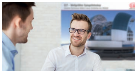
Interessante Aufgabengebiete, Teamwork & Projekte