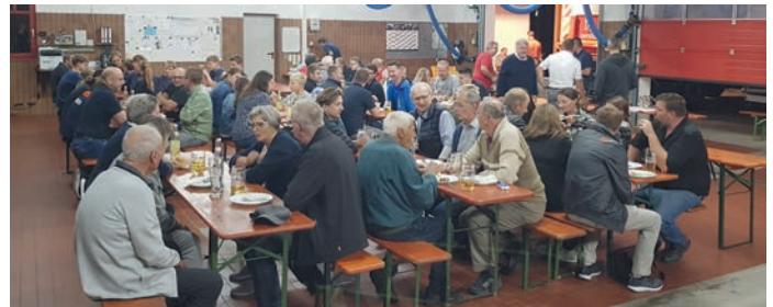
In der Fahrzeughalle wurde das neue Fahrzeug noch ein bisschen gefeiert.

Die offizielle Einweihung des 402.000 Euro teuren TLF 3000 und dem ebenfalls in diesem Jahr ausgelieferten Katastrophenschutz Versorgungslkw des Freistaates Bayern, erfolgt 2024. Für das TLF erhält der Markt Ortenburg noch Förderungen in Höhe von 73.000 Euro vom Freistaat Bayern sowie aufgrund der überörtli-