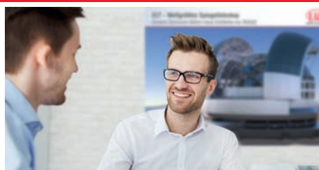
Interessante Aufgabengebiete, Teamwork & Projekte