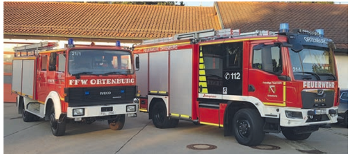
Das alte und neue Tanklöschfahrzeug der Freiwilligen Feuerwehr Ortenburg vor dem Gerätehaus. Das alte Fahrzeug wird verkauft.