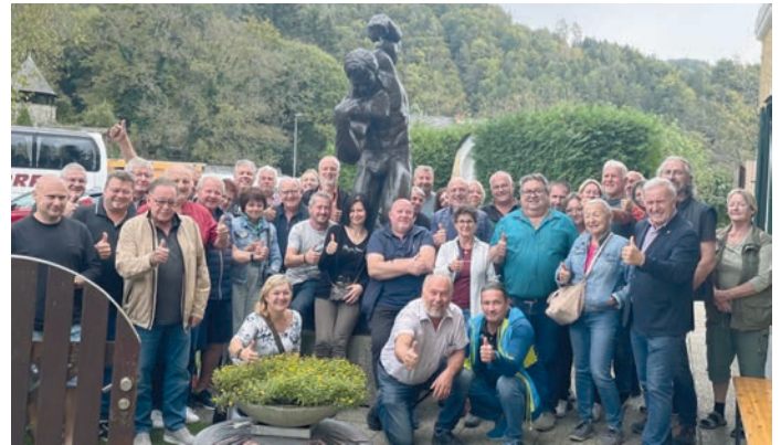
Eine weitere Station war das Arnold-Schwarzenegger-Museum in Graz.

Am Sonntag ging es über die südsteirische Weinstraße und die Schilcher Weinstraße nach Thal bei Graz, um dort das Arnold-Schwarzenegger-Museum zu besichtigen. Nach einem gemeinsamen Mittagessen zum Ausklang und dem Austausch