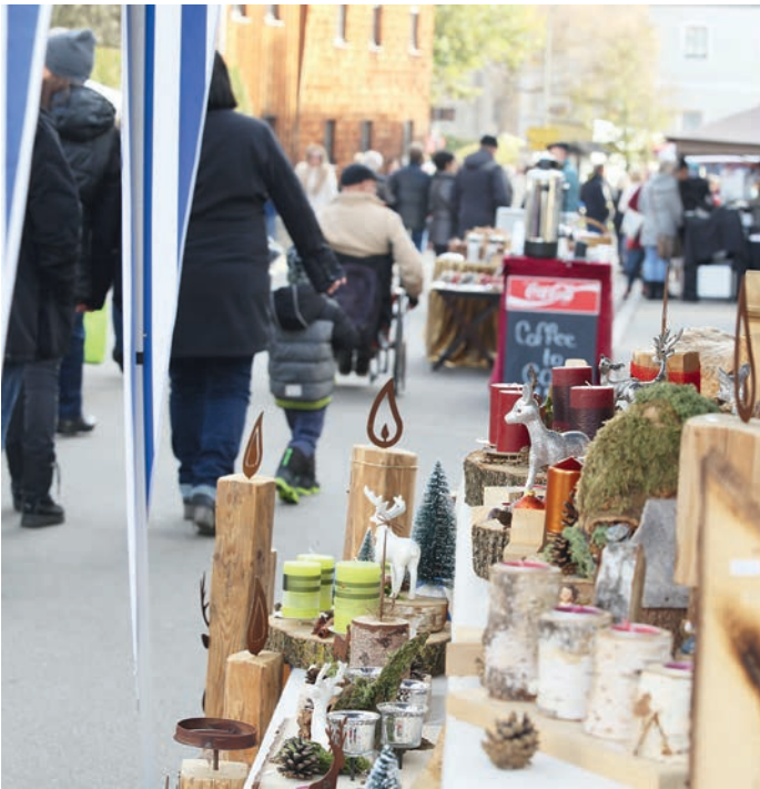
Mit weihnachtlichen Dekoartikeln, Adventskränzen und Gestecken stimmt der Adventsmarkt am 26. November bereits auf die Weihnachtszeit ein.