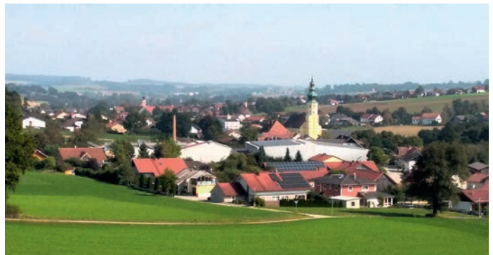
Initiativen, die das Leben auf dem Land abwechslungsreich machen, werden von der ILE Klosterwinkel gefördert.

Bereits zum fünften Mal hat sich die ILE Klosterwinkel beim Amt für Ländliche Entwicklung erfolgreich um die Teilnahme am Förderinstrument „Regionalbudget“ beworben. Demnach kann sie im kommenden Jahr bis zu 100.000 € an Dritte weitergeben, um Initiativen zur Förderung der ländlichen Entwicklung vor Ort anzustoßen. „Das Regionalbudget hat sich seit seinem Start im Jahr 2020 zu einer Erfolgsgeschichte