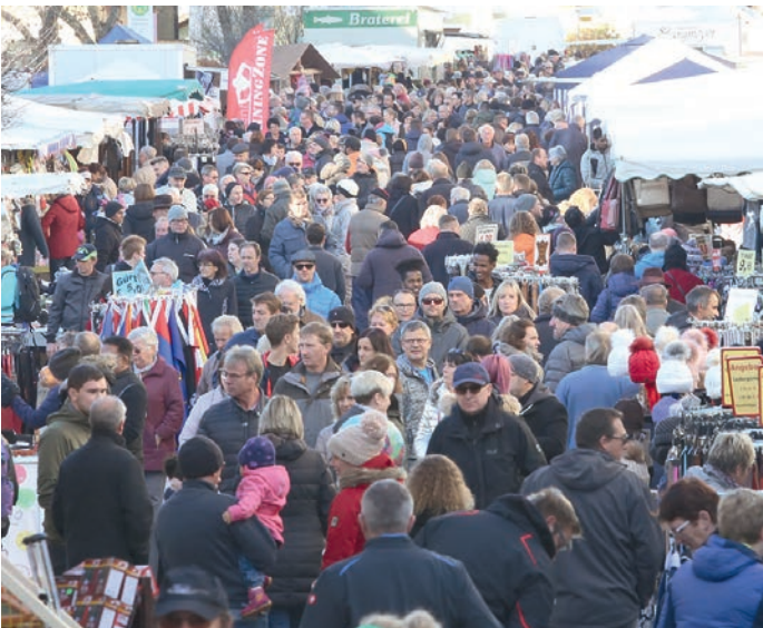
Auch heuer werden wieder viele Besucher beim Ortenburger Adventsmarkt mit verkaufsoffenem Sonntag am 26. November erwartet.

besonderes Highlight freuen – der Nikolaus wird vor Ort sein und unter dem leuchtenden Weihnachtsbaum sitzen. Hier haben die Kinder die einmalige Gelegenheit, ihm ganz persönlich von ihren Wünschen zu erzählen. Am Nachmittag zeigen die Ballettschüler der Tanzschule Loferer ihr Können. Für Interessierte hat die Tanzschule an diesem Tag die Türen am Standort im Hintermarkt geöffnet. Die Naschkatzen unter den Besuchern werden natürlich ebenfalls auf ihre Kosten kommen, denn es erwartet sie eine breite Auswahl an