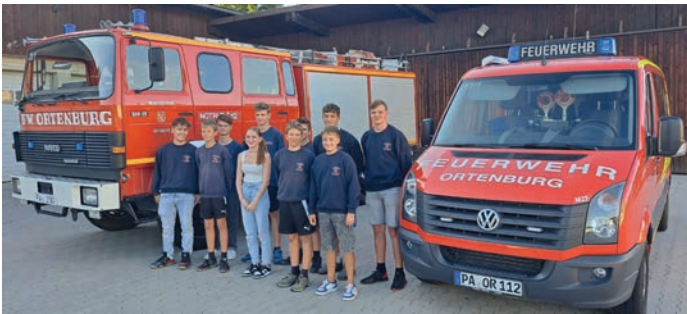
Die Mitglieder der Jugendfeuerwehr warteten am Bauhof gespannt, um die letzten Kilometer mit dem neuen TLF 3000 zum Gerätehaus nach Ortenburg mitzufahren, bzw. es mit dem alten Fahrzeug zu begleiten.