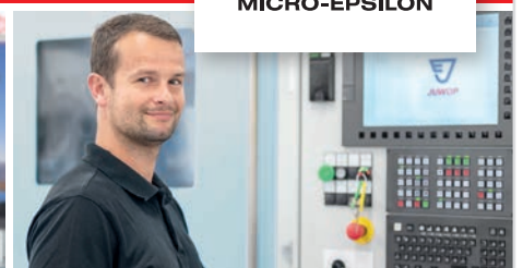
Modern ausgestattete Arbeitsplätze