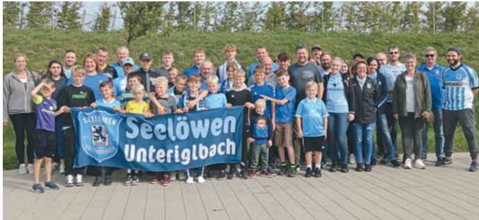
Der diesjährige Nachwuchsaktionstag der Seelöwen Unteriglbach war ein voller Erfolg. Kinder und Fanclub-Mitglieder hatten großen Spaß.

Die Seelöwen Unteriglbach haben heuer erneut zum Nachwuchstag eingeladen. So machte sich eine Gruppe mit Kindern gemeinsam mit den Mitgliedern auf zum Fußballspiel des TSV 1860, der an dem Spieltag auch noch erfolgreich war. Ein rundum gelungener Aktionstag für alle Beteiligten.