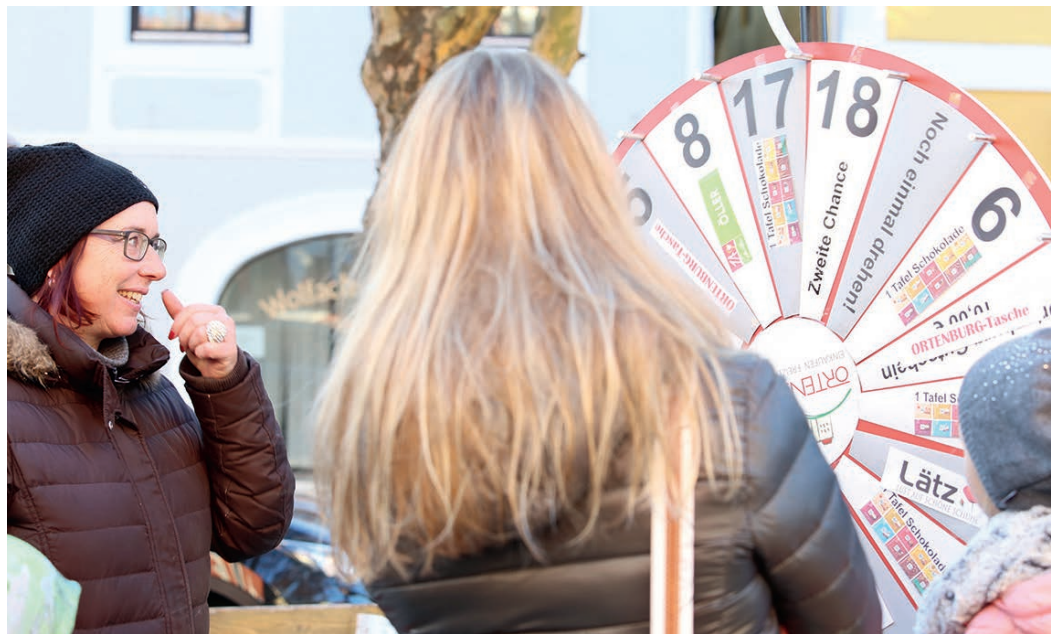
Beim Dreh am Glücksrad des Ortenburger Gewerbevereins winken tolle Preise der örtlichen Geschäfte.

P rächtige Dekoration, Lichterglanz und ein strahlender Weihnachtsbaum werden die Besucher des Ortenburger Adventsmarktes am 26. November in festliche Stimmung versetzen. Gleichzeitig ist verkaufsoffener Sonntag. Die Geschäfte haben von 11 bis 16 Uhr geöffnet. Kunden bekommen – solange der Vorrat reicht – Gratisblumen in Form von Weihnachtssternen überreicht. Der verkaufsoffene Sonntag bietet eine tolle Gelegenheit, schon einmal nach Weihnachtsgeschenken Ausschau zu halten. Aber auch die Ortenburger Gutscheinkarte kann erworben