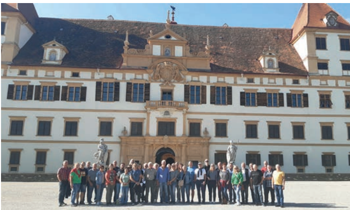
Die Reisegruppe stellte sich zum Gruppenfoto vor Schloss Eggenberg auf.

Steiermark, das immer wieder neue Sehenswürdigkeiten und kulinarische Superlative zu bieten hat, war diese Reise für alle Teilnehmer ein unvergessliches Erlebnis.