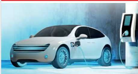
Arbeiten für die Branchen der Zukunft

Unsere Sensoren legen die Grundlage für eine moderne und lebenswerte Welt. Unsere Produkte steigern Leistung, optimieren die Qualität und schonen Ressourcen in zukunftsgerichteten Branchen.