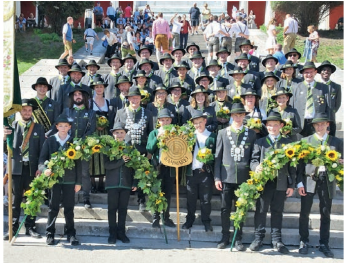
Stolz nahmen die Wolfachtaler Schützen Sammarei am traditionellen Trachten- und Schützenfestzug des Oktoberfestes 2023 teil.